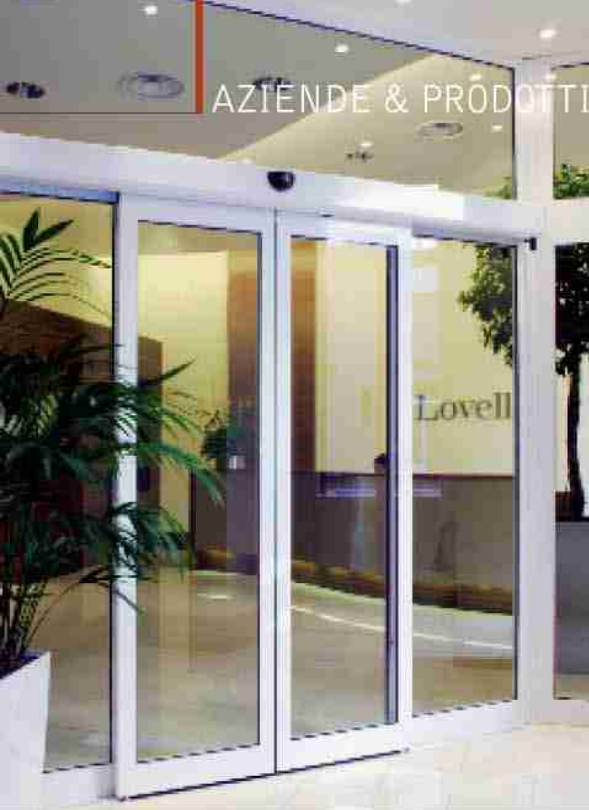
Porta scorrevole Ponzi TOS abilitata via di fuga