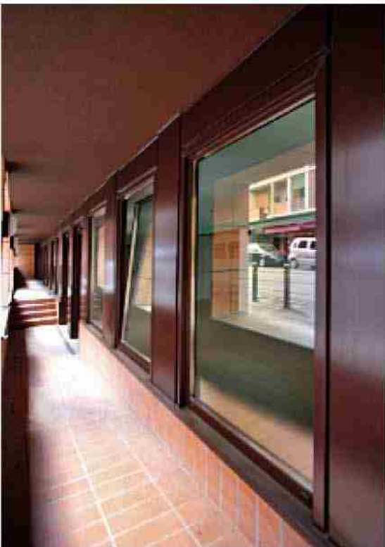
Vetrati isolanti fisse ed apribili