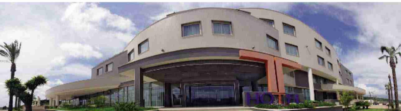
Una panoramica del THOTEL di Feroletto Antico, Lamezia Terme (CZ) e il dettaglio della porta scorrevole Ponzi tutto vetro