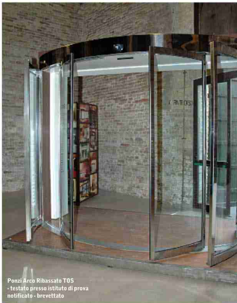
Ponzi Arco Ribassato T0S - testato presso istituto di prova notificato - brevettato