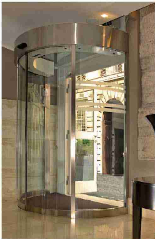
Porta scorrevole curva Ponzi Rondina, Hotel St George, Roma