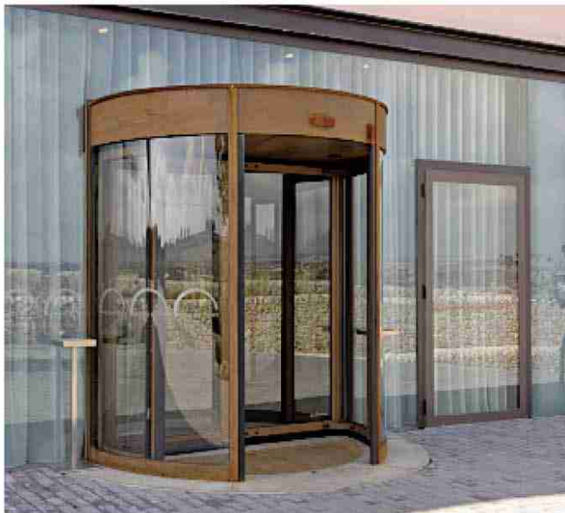
Porta girevole Ponzi a due ante finiture in acciaio Corten, Poggio del Sole Resort, Ragusa

“È vero. La legislazione favorisce sempre più chi interviene sull'edificio alberghiero per abbattere i consumi energetici e migliorare il comfort acustico. Nelle costruzioni e ristrutturazioni, ove si applichino questi parametri, è consentita una detrazione pari fino al 55 per cento dei costi sostenuti. Realizziamo finestre che consentono un abbattimento acustico fino a 42 decibel e un coefficiente termico medio di k 1,4. L'alluminio è un materiale nobile, indistruttibile e riciclabile. Le finiture sono molteplici con trattamenti di anodizzazione e/o verniciatura a forno con il colore classico dell'alluminio, con co-