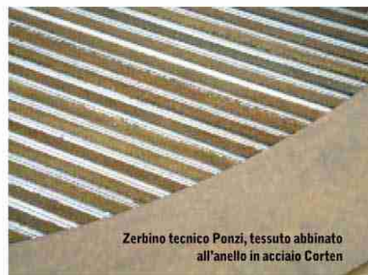
Zerbino tecnico Ponzi, tessuto abbinato all'anello in acciaio Corten

clienti nel momento stesso in cui entrano in albergo. Li abbiamo realizzati abbinando l'alluminio degli sfridi della nostra produzione con la gomma riciclata dei pneumatici delle automobili. Ora disponiamo anche di una nuova tipologia di zerbini tecnici realizzati abbinando l'alluminio con dei tessuti. Ciò consente di proporre una gamma più ampia di alternative che assecondino non solo l'aspetto funzionale degli zerbini ma anche le esigenze estetiche del progettista o dell'albergatore. È un prodotto formidabile per salvaguardare la pulizia e l'integrità della hall".