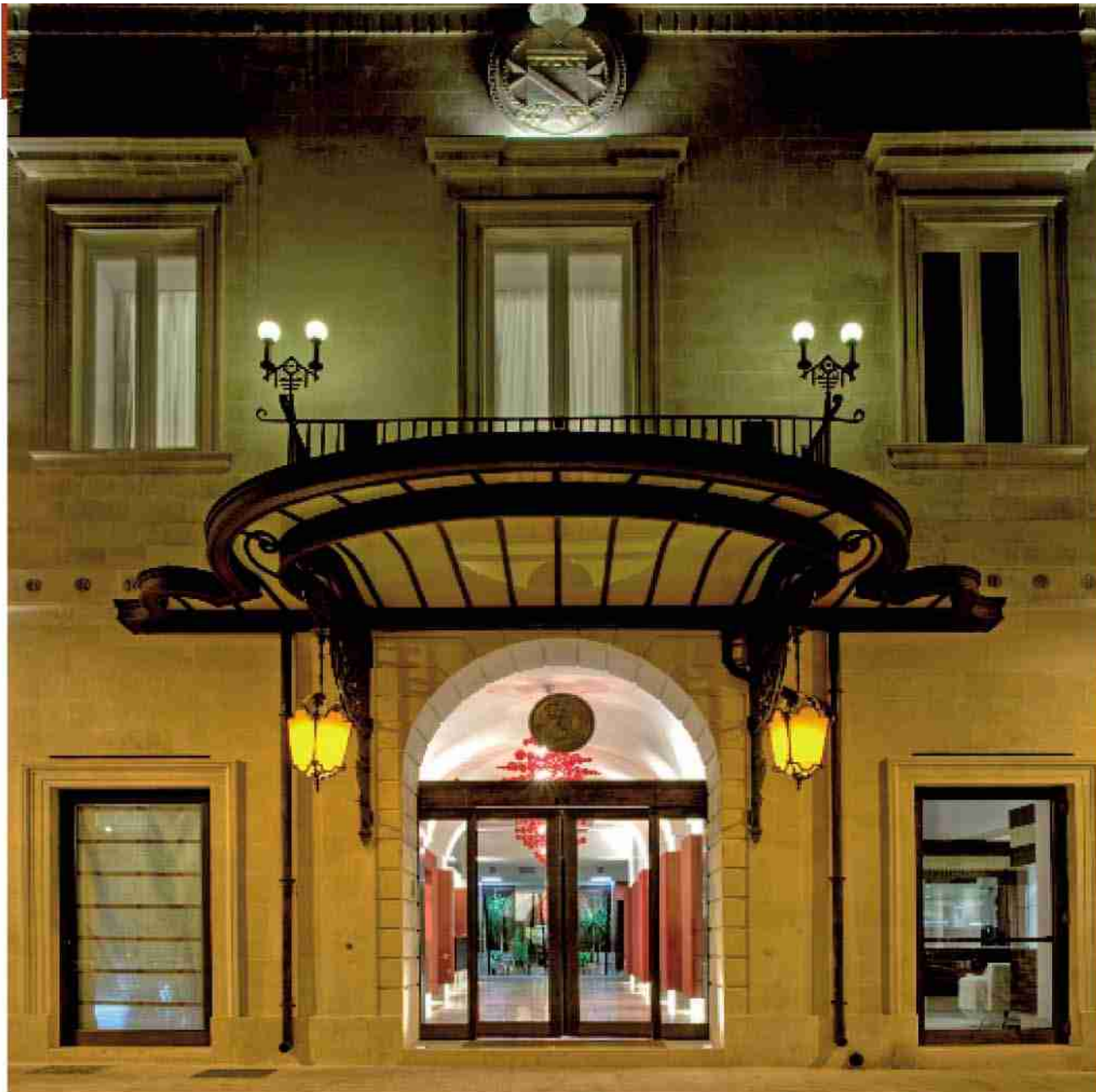
Porta scorrevole Ponzi finitura in bronzo, Hotel Risorgimento, Lecce

L'azienda di Bagnara di Romagna opera nel settore dei serramenti da oltre mezzo secolo e da circa vent'anni in quello degli ingressi automatici. Innovazione, sicurezza, funzionalità, affidabilità, servizio postvendita sono i capisaldi di Ponzi. L'azienda a conduzione familiare con l'impronta dell'industria ha una consolidata esperienza nel fornire consulenza relativa all'ingresso automatico inteso come macchina tecnologica, nel porre attenzione all'aspetto strutturale e di design, nel fornire infissi di ultima generazione per gli edifici alberghieri. L'importanza degli infissi e degli ingressi risiede nel controllo termo – acustico