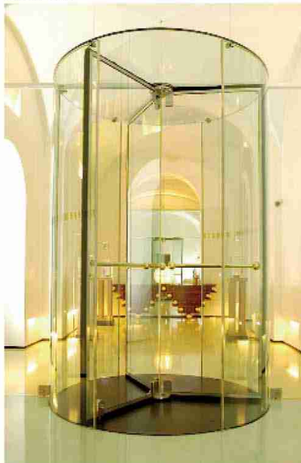
Porta girevole tutto vetro Ponzi Crystal TG