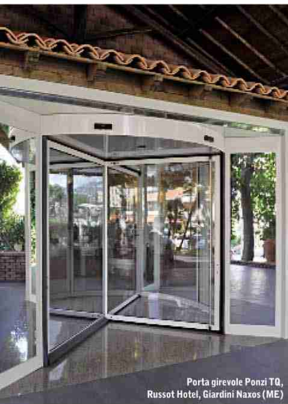
Porta girevole Ponzi TQ, Rusot Hotel, Giardini Naxos (ME)