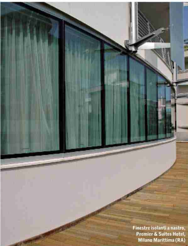
Finestre isolanti a nastro, Premier & Suites Hotel, Milano Marittima (RA)