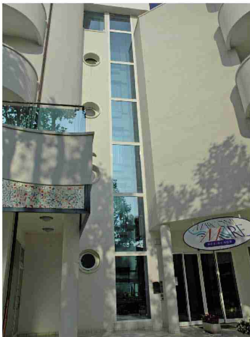
Facciata continua a montanti a traversi, Hotel Marconi Mare, Riccione (RN)