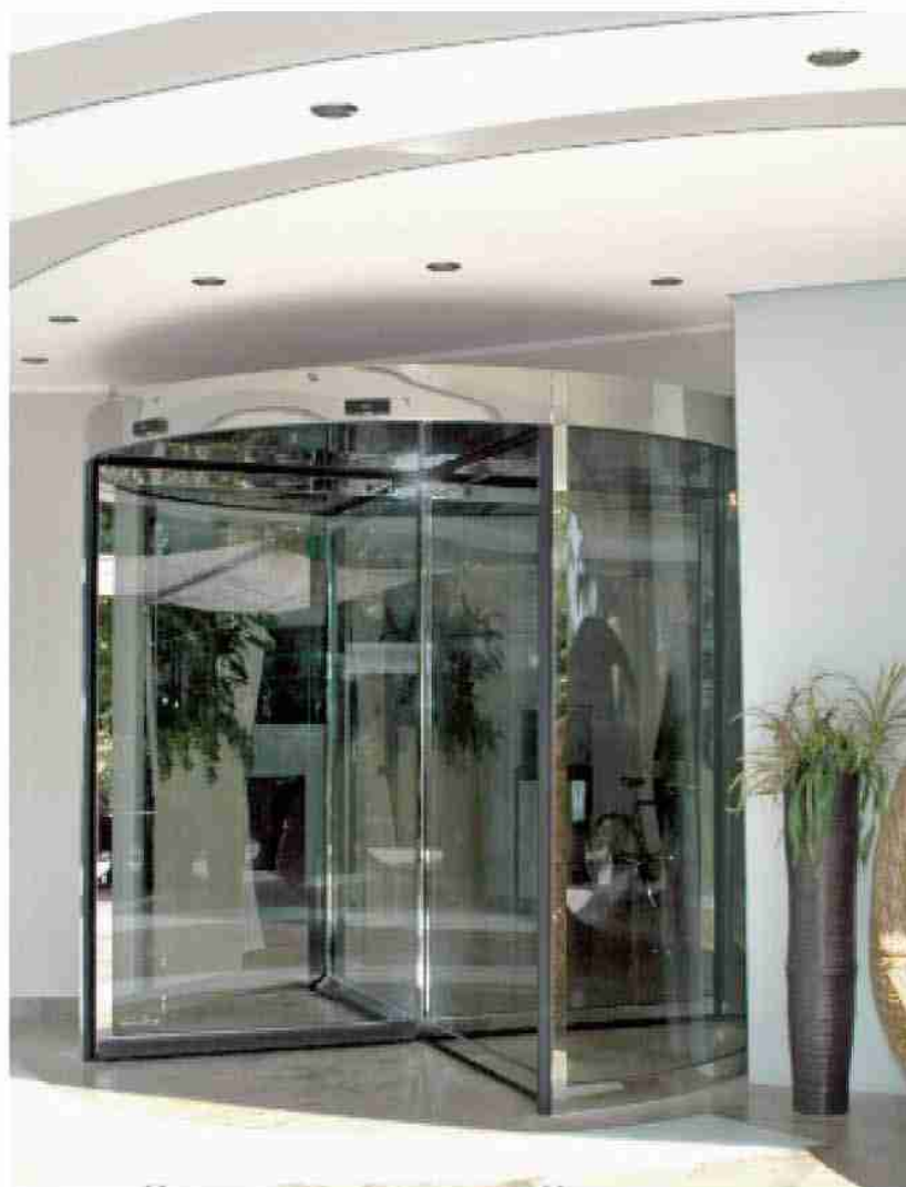
Porta girevole Ponzi TQ in acciaio inox, finitura a specchio, Premier & Suite Hotel, Milano Marittima