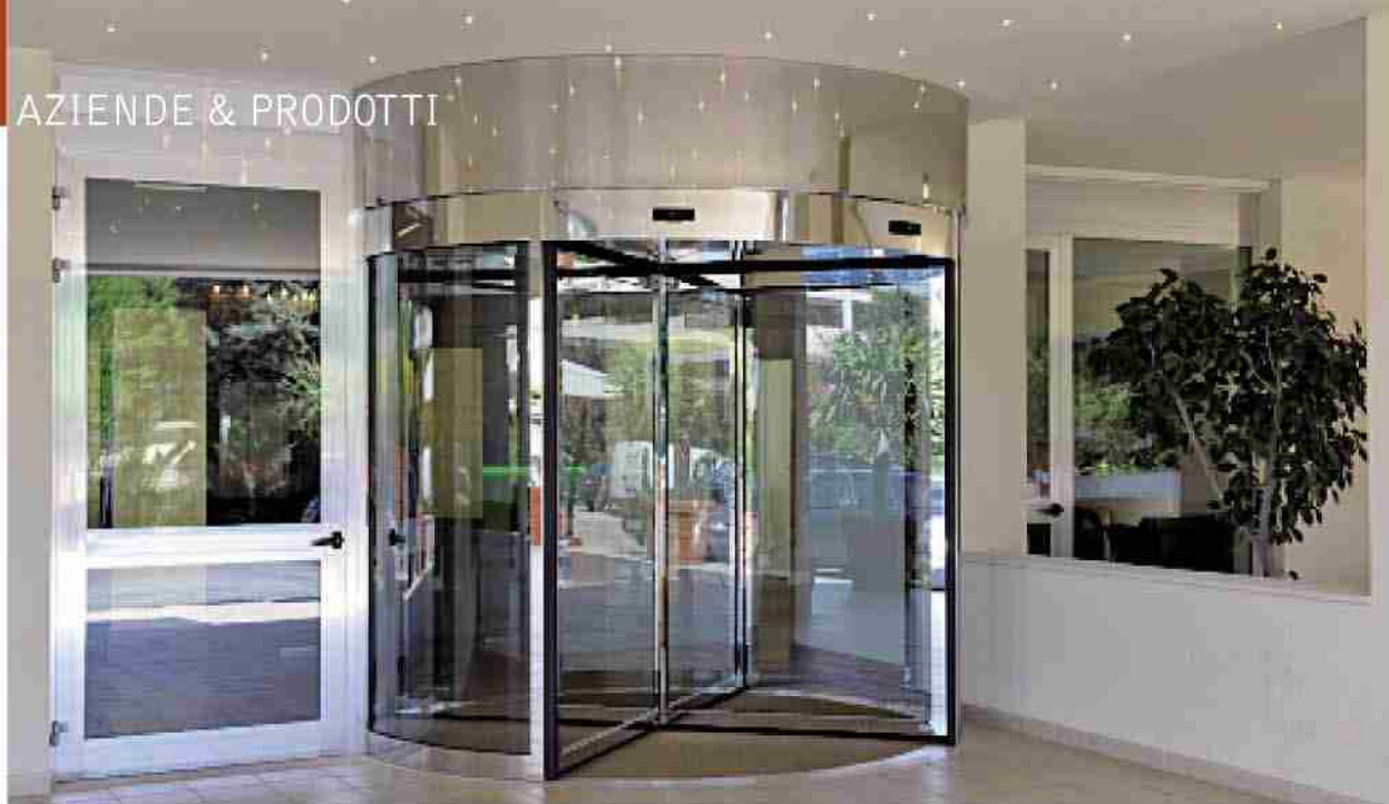
Porta girevole Ponzi TQ in acciaio inox, finitura a specchio, Hilton Garden Inn, Siracusa